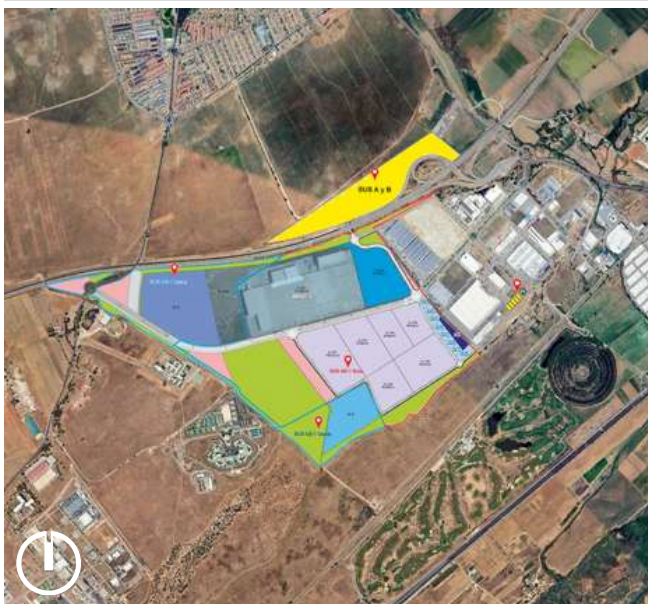
Plano de la Finca